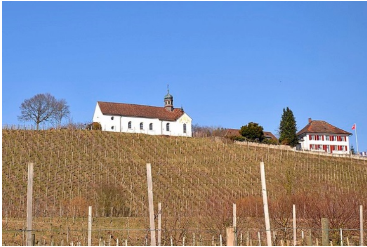
Rebberg unterhalb der Kirche von Warth